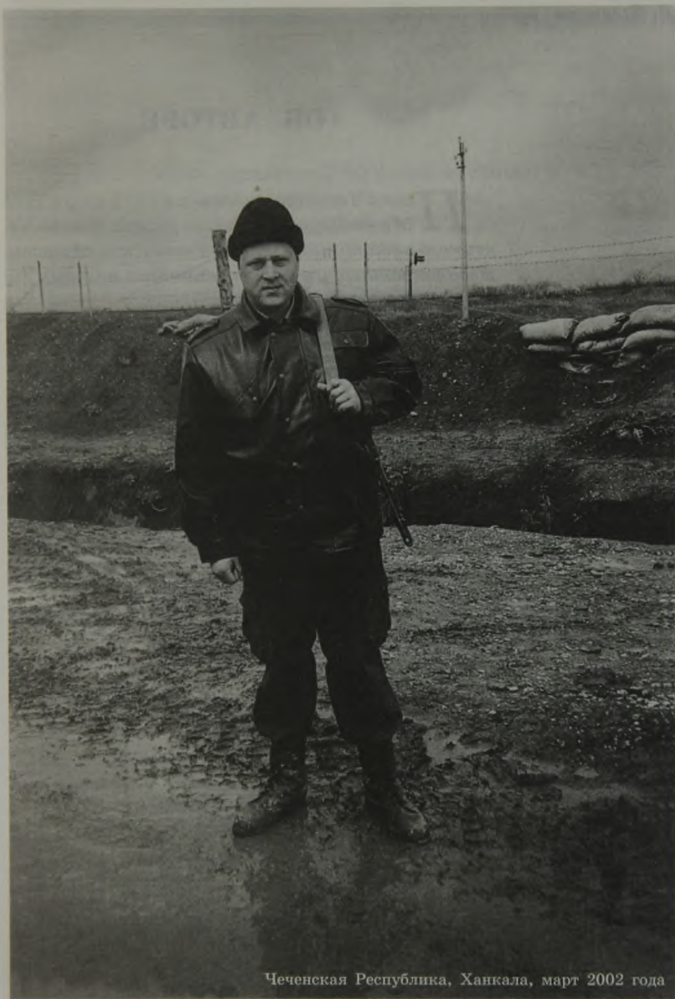
Чеченская Республика, Ханкала, март 2002 года