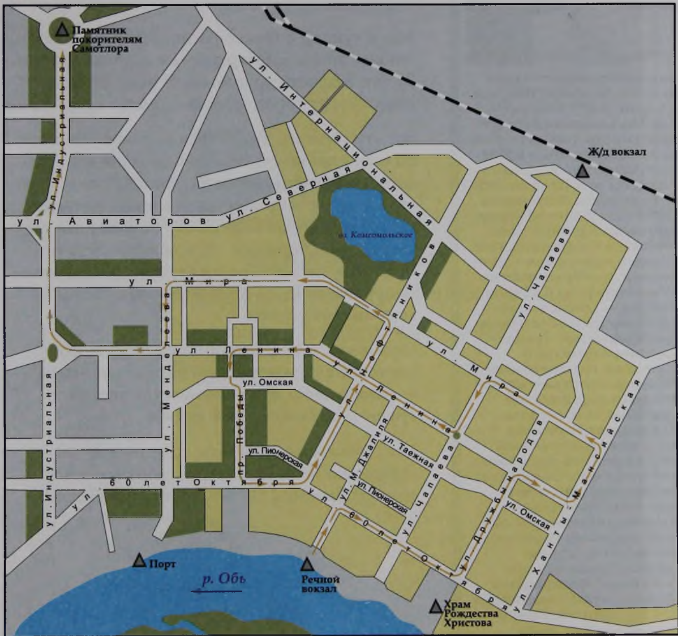
Схема экскурсии по Нижневартовску