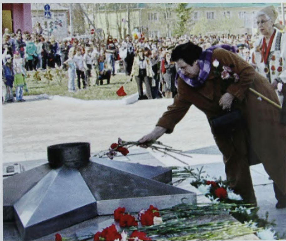
Возложение цветов к Вечному огню