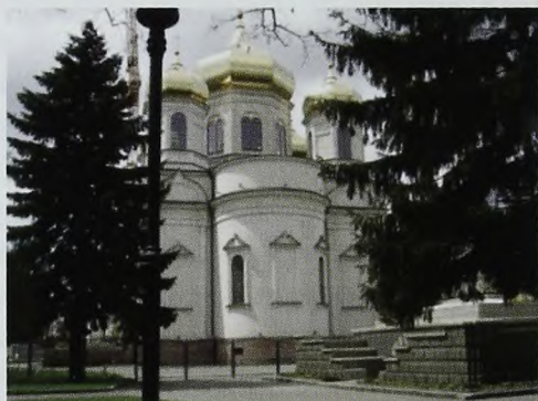
г. Ставрополь, Кафедральный собор

В детстве я очень любил гулять с бабушкой Екатериной Ивановной, с особым нетерпением ждал очередной прогулки. Мечтал увидеть, узнать что-то новое, интересное, мною неизвестное. Это не зависело от того, идём ли мы в парк, на бульвар, в музей, или к озеру, роднику или на Комсомольскую горку, в храм. Наши прогулки имели, как я позднее понял, определённую цель. Моя бабушка, будучи учителем, стремилась приоб-