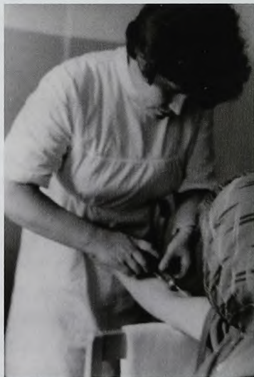
В процедурном кабинете